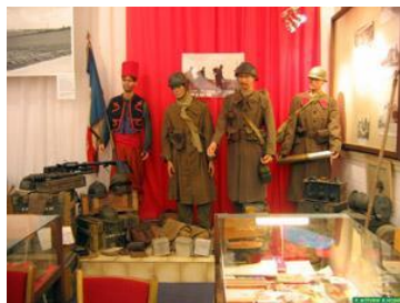
Le musée français