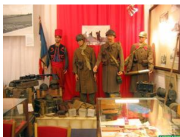
Le musée français